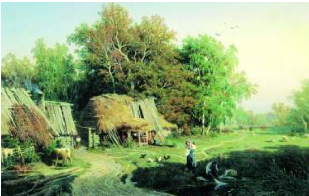
Деревня. Худ. Ф.А. Васильев. 1869 год

Обычно крепостничество представляется одним сплошным кошмаром. Для многих оно – исключительно «ужас и позор России». Хотя крепостное право было в истории всех стран, а значит, это всеобщий «позор». Владимир Маяковский писал: «Ведь, если звезды зажигают – значит – это кому-нибудь нужно?» Если крепостничество как институт столетиями существовало в России и других странах, значит, для этого были серьезные основания. Значит, оно выполняло важные, полезные функции. Наша задача – разобраться в этом, а не заклеить.