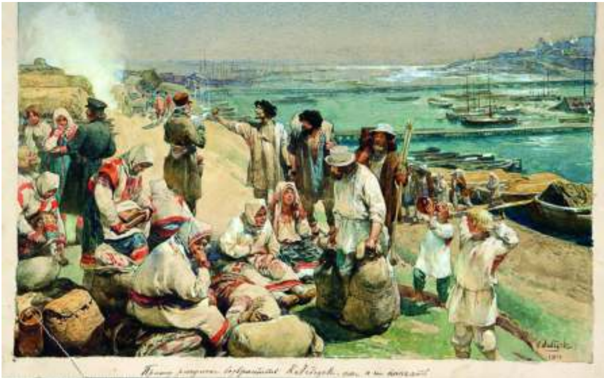
Продажа крепостных на Нижегородской ярмарке. Худ. К.В. Лебедев. 1910 год