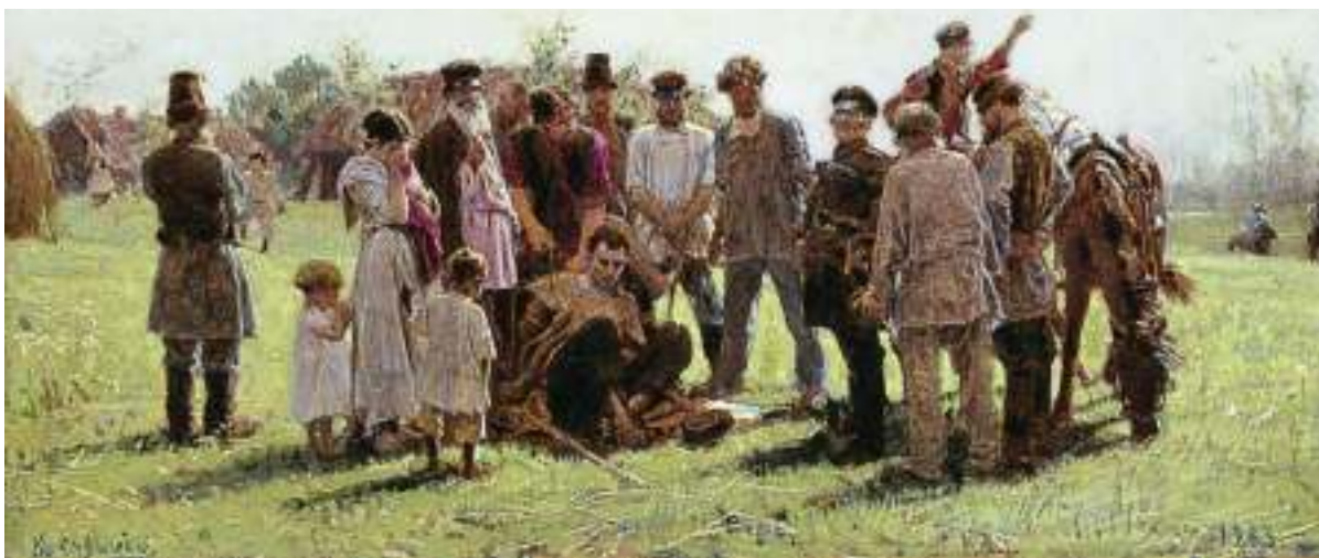
Бе́лый. Худ. К.А. Савицкий. 1883 год

– Крестьянский вопрос, который стоял на повестке дня в течение нескольких десятилетий, решила реформа 1861 года. Что стало причиной преобразований?